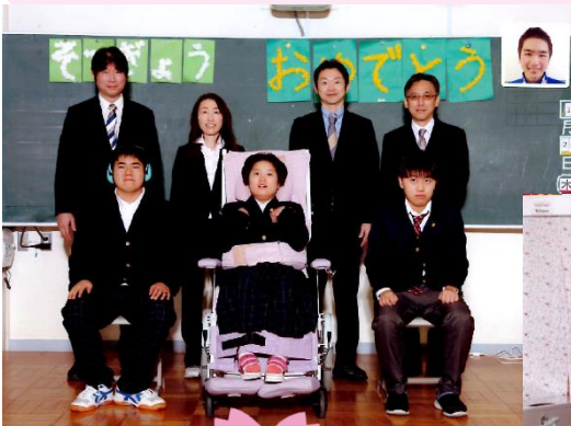
卒業写真 みんなで撮りました

本日、小学部6年生2名、中学部3年生4名が卒業しました。これからそれぞれ自分の道を自分で歩いていくことになります。それぞれの場所で自分らしく輝く姿を教職員一同願っています。